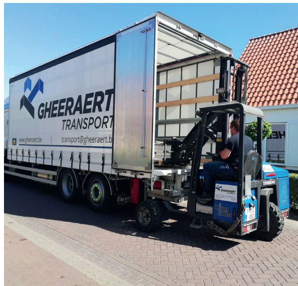
Leveringen met kraai